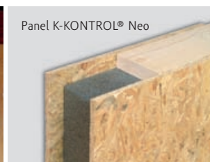
Panel K-KONTROL® Neo